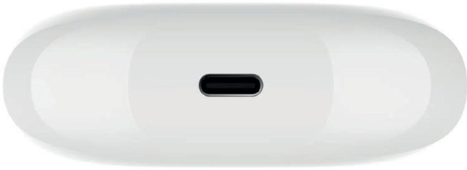
Kutunun Alt Kısmı

Kutunun alt kısmındaki girişe Type-C kablosunu takın Kutu Şarj olurken bildirim ışığı kırmızı, şarj tamamlandığında yeşil yanacak.