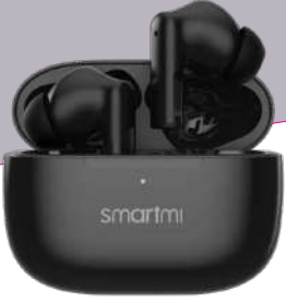
MJ141 Kullanma Kılavuzu