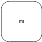
Mi Box S