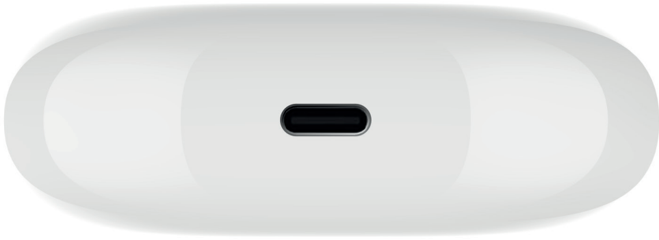
Kutunun Alt Kısmı

Kutunun alt kısmındaki girişe Type-C kablosunu takın Kutu Şarj olurken bildirim ışığı kırmızı, şarj tamamlandığında yeşil yanacak.