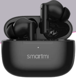
MJ141 Kullanma Kılavuzu